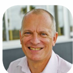
JF LAPLUME Aquitaine Europe Communication, Bordeaux