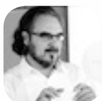
JF CARRASCO GM Consultants & Associés, Nice